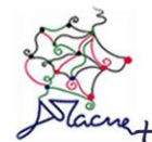
Tabla de versiones